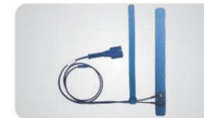
Capteur d'enveloppement pour nouveau-né