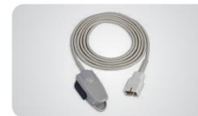
Capteur à clip pour adulte