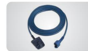
Capteur souple pour adulte