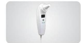
Thermomètre auriculaire infrarouge