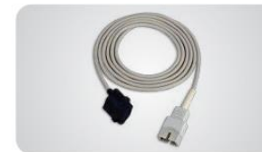
Capteur souple pour enfant