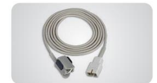
Capteur à clip pour enfant