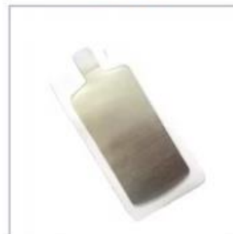
Surgical Diathermy Plate