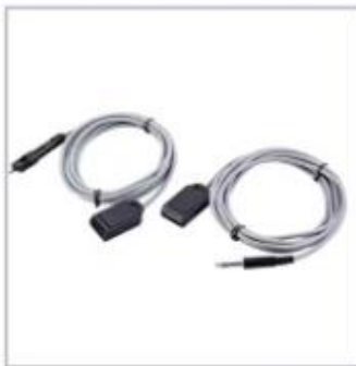
ESU Patient Plate Cable