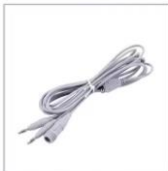
Bipolar Forceps Cable